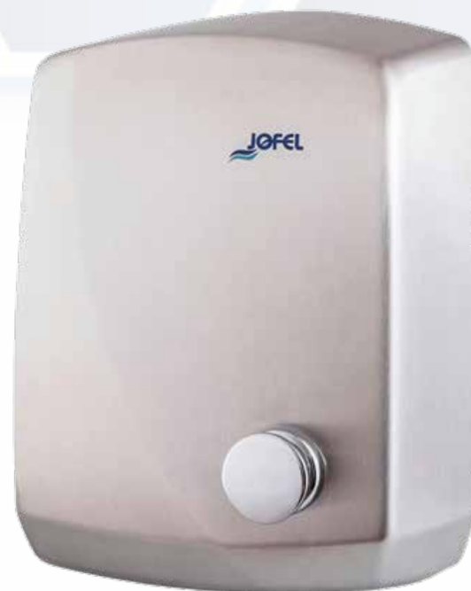
ESQUEMA DE PRODUCTO: