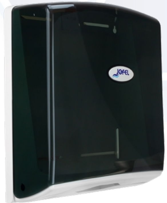
ESQUEMA DE PRODUCTO: