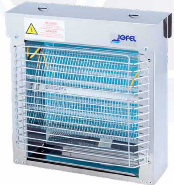
ESQUEMA DE PRODUCTO:

- Fabricado íntegramente en acero inox aisi 430 pulido