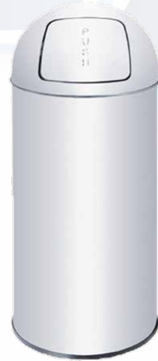
ESQUEMA DE PRODUCTO: