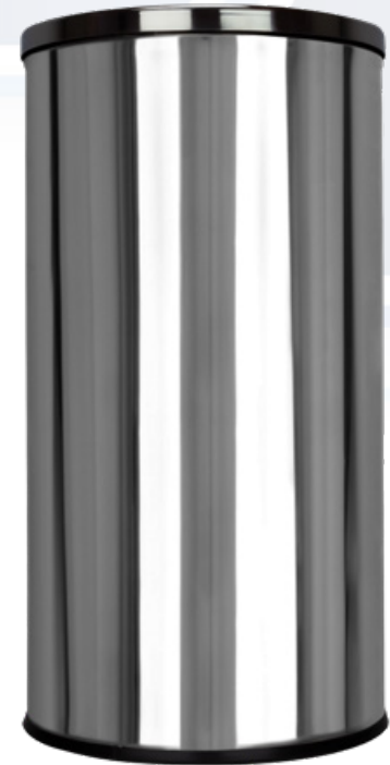
ESQUEMA DE PRODUCTO: