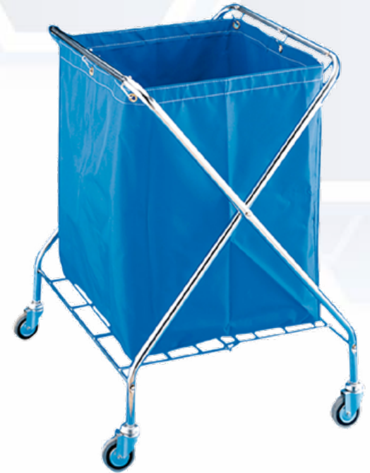
ESQUEMA DE PRODUCTO: