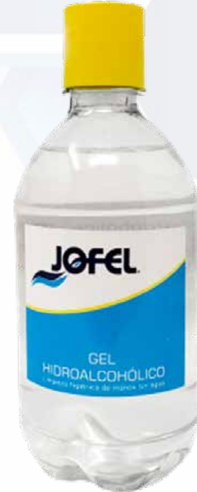
ESQUEMA DE PRODUCTO: