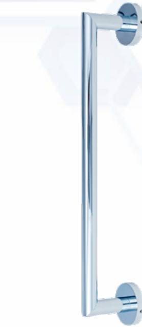
ESQUEMA DE PRODUCTO:

Por medio de tornillos y tacos incluidos, 4 tacos, 4 tornillos y 1 llave Allen.