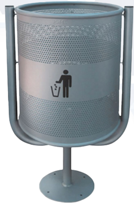
ESQUEMA DE PRODUCTO: