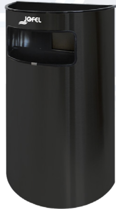
ESQUEMA DE PRODUCTO: