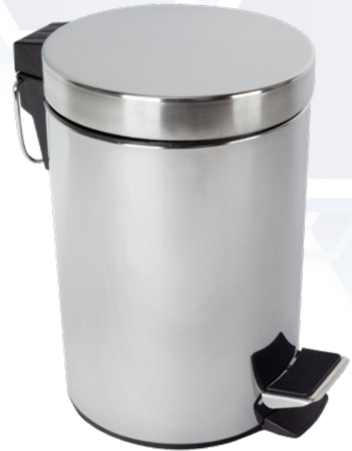
ESQUEMA DE PRODUCTO: