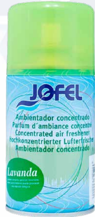
ESQUEMA DE PRODUCTO: