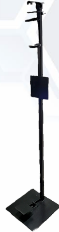
ESQUEMA DE PRODUCTO: